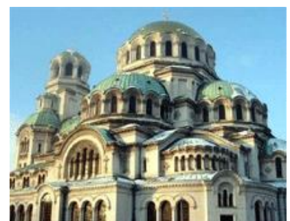
La cathédrale Alexander Nevsky

Par conséquent, sauf à des fins de communication, elle constitue un cul-de-sac. Dans le passé, cependant, la région a été un tremplin décisif pour de grands hommes aussi prestigieux qu'Alexandre et Constantin. Les frontières culturelles de l'Europe .