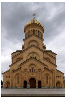
Sameba Holy Trinity Cathedral

La Géorgie, avec les petites contrées caucasiennes d'Abkhazie et d'Ossétie, est située au nord de l'Arménie et à l'est de la mer Noire. Cette géographie européenne a survécu principalement grâce à l'avancée de la Russie vers le sud au XVIII e siècle. Cependant, la chronologie bolchévique russe du XX e siècle a manifestement interrompu cette poussée progressive de la Russie. Cartographie de l'Arménie [p. 26].