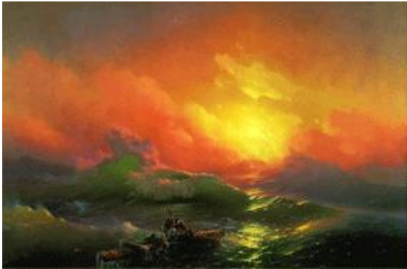
The European Sector of the Northern Caspian is the point from which commences a major latitudinal dividing line, extending eastwards to Vladivostok and a vital Pacific Ocean outlook. The illustration is Aivazovsky's Ninth Wave .