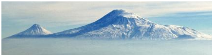
Le mont Ararat : Zénith du Plateau arménien

La terre d'Ararat est la plus exposée des régions en question. L'Arménie, un plateau montagneux distinct dont le point culminant est le mont Ararat biblique, est située au sud des montagnes du Caucase. La nation arménienne s'est formée sur ce plateau et habite sa terre d'origine depuis des milliers d'années. Dans le passé, cependant, les royaumes arméniens se sont étendus bien au-delà de leur plateau d'origine, jusqu'à la Méditerranée et la mer Caspienne. Aucune nation n'avait habité le Plateau avant les Arméniens. Des États tels que la République d'Arménie et le Haut-Karabakh, ou pour donner à ce dernier son titre original exact, l'Artsakh, se sont constitués sur son secteur oriental. Le haut plateau sacré de la Bible .