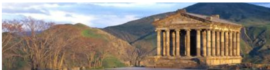
Temple hellénistique de Garni, Arménie 1er siècle après J.-C.,

La terre d'Ararat est la plus exposée des régions en question. L'Arménie, un plateau montagneux distinct dont le point culminant est le mont Ararat biblique, est située au sud des montagnes du Caucase. La nation arménienne s'est formée sur ce plateau et habite sa terre d'origine depuis des milliers d'années. Dans le passé, cependant, les royaumes arméniens se sont étendus bien au-delà de leur plateau d'origine, jusqu'à la Méditerranée et la mer Caspienne. Aucune nation n'avait habité le Plateau avant les Arméniens. Des États tels que la République d'Arménie et le Haut-Karabakh, ou pour donner à ce dernier son titre original exact, l'Artsakh, se sont constitués sur son secteur oriental. Le haut plateau sacré de la Bible .