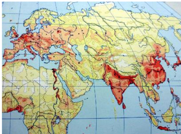
Плотность населения в конце XX в.

Важность вышеупомянутых культурных границ Европы может быть усилена в свете новых глобальных тенденций, которые стали развиваться в последнем десятилетии XX века. Цивилизации или их отдельные аспекты становятся влиятельными глобальными факторами. Следовательно, упор стал делаться не на устойчивых физико-географических очертаниях, а на культурную географию с определенными границами, которые отделяют цивилизации демографически.