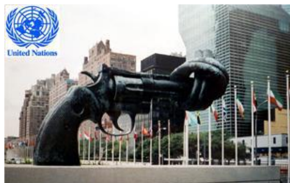
ООН, Нью-Йорк, подарок Люксембурга, 1988 г.

Принцип мирного урегулирования споров, конечно, сохраняет свою важность. Другие аспекты, такие, как посредничество, обязательная международная процедура арбитража, санкции, плебисциты, а также права человека, представленные, например, в теме Права и ценности также могут быть приняты во внимание.