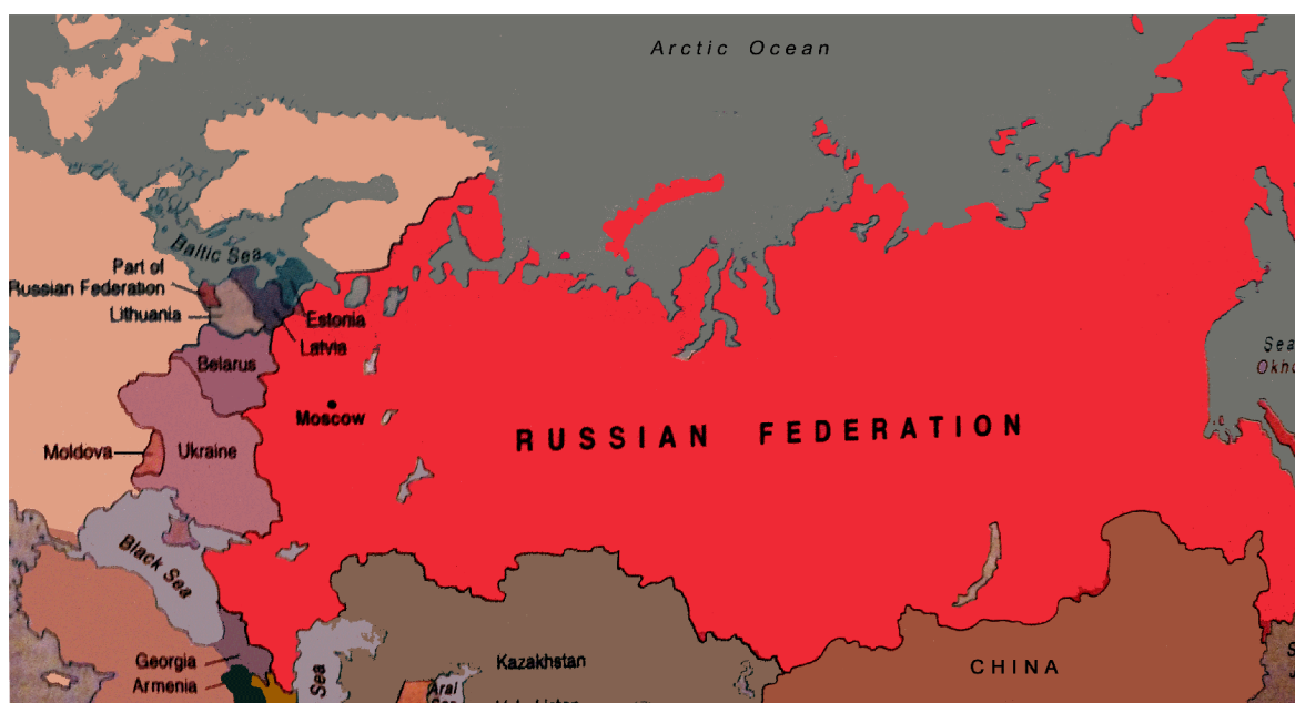
Este: Perspectiva de Pacífico, con fronteras intercontinentales considerables

Debido a los desenvolvimientos geopolíticos europeos arriba mencionados, se ha añadido a la Unión Europea un trecho significativo de territorio desde el Báltico hasta el mar Negro. Por lo tanto, esta progresión oriental ha incorporado Polonia en el norte, así como las repúblicas checa, eslovaca y húngara situadas en Europa central. Por lo tanto en el sur, Rumanía y Bulgaria se han incorporado, proporcionando a la UE una línea costera estratégica en el mar Negro. El bosquejo de mapa arriba presentado registra principalmente las repúblicas sucesoras independientes del estado soviético. Los tres pequeños países bálticos ya han accedido. En consecuencia en este camino oriental general sólo seis estados permanecen en la posibilidad de incorporarse dentro de las Fronteras Culturales Europeas. Belarús, Ucrania y Moldavia en el este, y Georgia y Armenia situadas inmediatamente al sur del Cáucaso. El futuro del éxito global de Europa se decidirá finalmente con la adhesión de la Federación de Rusia, como sexto candidato. Es obvio para todos que esta etapa final puede ser el paso más desafiante de todos. Sin embargo, una visión retrospectiva a mediados del siglo veinte indica que el Proyecto Europeo durante sus años embrionarios también se enfrentó a obstáculos difíciles. Sin duda alguna, hay que cruzar barreras abrumadoras y mantener la determinación, ya que no existe una alternativa razonable al Proyecto Europeo en marcha.