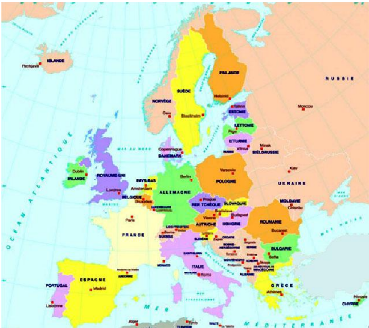
Oeste: Perspectiva del Atlántico, con fronteras marítimas considerables

En años posteriores, también ha sido prudente tener en cuenta los avances económicos y militares demostrados por otros, especialmente China y, en menor medida, India. Ambos pueden considerarse como entidades desarrolladas desde el punto de vista de los "mayores" estados. Su capacidad para incorporar poblaciones masivas dentro de las fronteras de iure es impresionante. Ahora está bastante claro que Europa tiene que ponerse al día o permanecer en el futuro subordinada a nuevas potencias superiores. El Futuro de Integración Europea . El futuro de Europa no puede ponerse en riesgo.