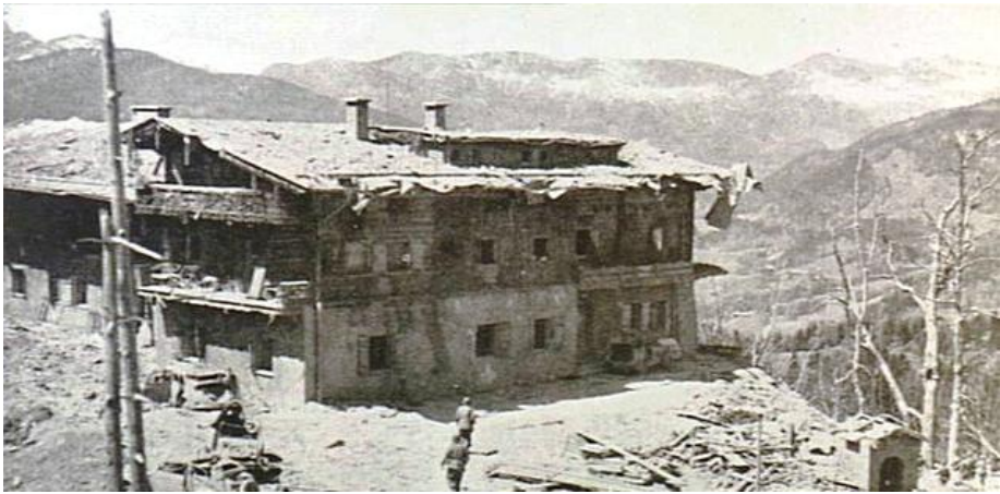
Օբերապրերգ, Բավարիա. Երրորդ Ռեյխի հիերարխիային պատկանող Ալպիական համալիր: Այն նաև բնակեցվում էր SS-ական գործերի ջոկատներով, որոնք ապահովում էին Ֆյուրերի անվտանգությունը: Սարի գագաթին գտնվող ամենաբարձր շինությունը համարվում էր հեղինակավոր «Արծվի Բույնը»: Համալիրը ավերվել էր 1945թ. ապրիլի 25-ին օդային հարվածներից, որը պլանավորված էր Դաշինքի ուժերի ուժակոծումներ իրականացնող հրամանատարության կողմից:

Ազգային Մոցիալիզմի ցայտուն գաղափարախոսական նպատակներից մեկը եվրոպական ռասսայի վերաինժենեթավորման փորձն էր: Երևի թե այս նպատակը ամենաանհրատեսականն էր: Լավագույնը կլինեք պահպանել այն ինչ արդեն կար: Նացիստական գաղափարախոսությունների ջերմեռանդ իրագործումը մայրցամաքային Եվրոպայում որոշ չափով հարուցել է Եվրոպական քաղաքակրթության ստրատիֆիկացիոն հավասարակշռության շեղումներ: Եվրոպայի Մահմանները : Հետևաբար, մի շարք չափանիշներ և արժեքներ պետք է վերահաստատվեն և վերաուղղվեն, և դրանք պետք է ներառեն գլոբալ ճյուղավորումների հետևանքային զարգացումները: Իրավունքներ և Արժեքներ : Ռասիստական-ազգային գաղափարախոսությունները, որոնք ձևավորվում են ներքին կամ արտաքին մակարդակներում, ինչպես նաև արտաքին ուժերի կողմից ուղղորդվող քաղաքականացված ընդլայնվողական կրոնական շարժումները, որոնք կասկածի տակ են դնում Եվրոպական քաղաքակրթությանն իր իսկ գլոբալ աշխարհագրական տիրույթում, ինչպես դա ցույց տրվեց վերևում, կարելի է վերջնականապես վերացնել: Ամենից առաջ, իհարկե, պետք է չկրկնել անցյալի սխալները: