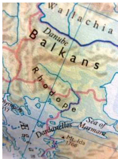
Frontières Culturelles s'étendant de la Mer Égée à la Mer Noire

Frontières Culturelles de l'Europe: Les Zones à risques en Europe.