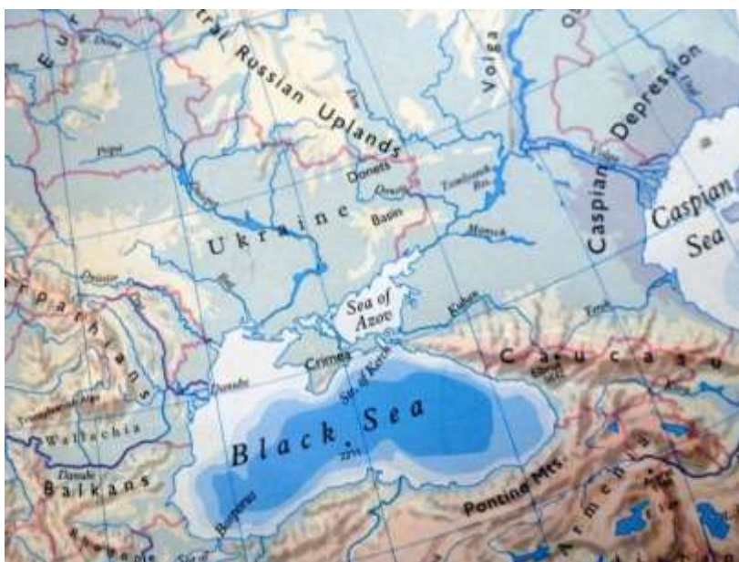
Le Nord de la Mer Caspienne, le Caucase occidental, la Mer Noire et l'Arménie.

Parmi ces trois régions, le pays d'Ararat est le plus menacé. L'Arménie, plateau montagneux parfaitement délimité dont le sommet, le Mont Ararat, est mentionné dans la Bible, est situé au sud des Montagnes du Caucase. La nation arménienne y fut fondée et les Arméniens ont habité sur les lieux de leurs origines pendant des milliers d'années. Dans le passé, cependant, des royaumes arméniens se sont étendus bien au-delà du Plateau sur lequel ils avaient pris naissance, par exemple jusqu'à la Méditerranée et la Mer Caspienne. Aucune nation n'a vécu sur le Plateau avant les Arméniens. Des états comme la République d'Arménie ou le Haut-Karabagh, ou, pour lui donner son nom d'origine, plus juste, l'Artsakh, se sont formés sur sa partie orientale.