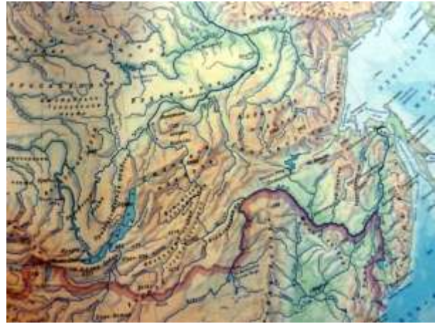
Le Nord de la Mer Caspienne jusqu'à Vladivostok et la façade sur l'Océan Pacifique