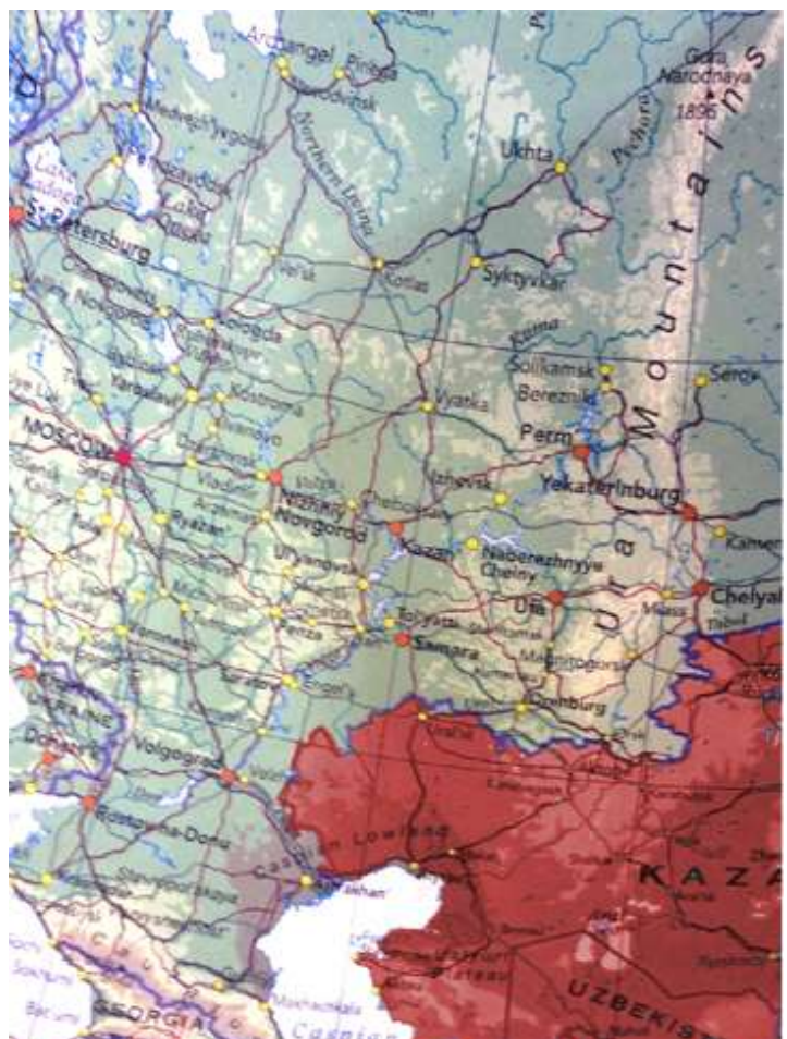
L'Europe de l'Est, le Nord de la Mer Caspienne et les Montagnes de l'Oural

A Il s'agit d'une vaste frontière s'étendant à l'Est depuis la partie septentrionale de la Mer Caspienne, enclavée dans les terres, jusqu'à Vladivostok, où existe une importante façade sur le Pacifique. De l'autre côté, le secteur européen de la Mer Caspienne est situé au sud-ouest de l'Oural. Cette chaîne de montagnes ne constitue pas une séparation géographique pour la Civilisation européenne. La géographie culturelle et les facteurs démographiques restent les éléments principaux. Même si le point le plus méridional est le plus exposé, les territoires orientaux demeurent cependant les plus dangereux. Il n'existe aucun droit à l'erreur sur l'un et l'autre front..