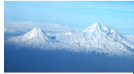
La cartographie de l'Arménie

En 380, l'Édit de Thessalonique, promulgué par l'Empereur Théodose I er , a proclamé le christianisme religion officielle d'État du monde romain. Il a efficacement prohibé le polythéisme romain. Comme résultat, l'Empire a accédé au niveau atteint par l'Arménie des décennies auparavant. Théodose I er a été le dernier empereur à régner sur les parties occidentale et orientale de l'Empire. Un aspect plus progressiste de civilisation avançait avec confiance et cette civilisation devait devenir mondiale. Bien plus, la Croix allait se transformer en emblème interculturel.