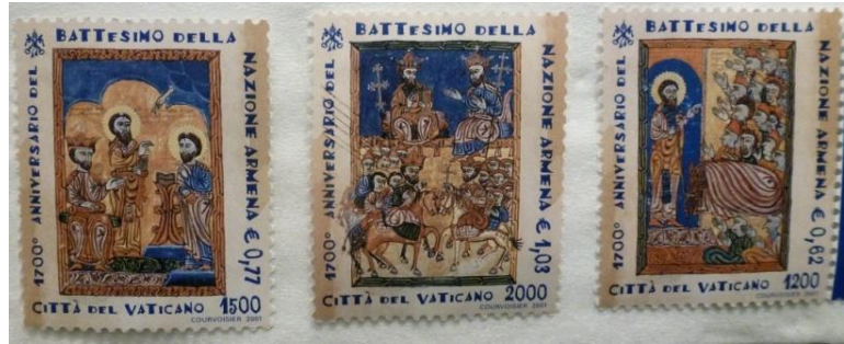
En 2001, de nombreux chefs d'Églises se sont réunis en Arménie pour commémorer l'adoption du christianisme en Arménie en 301. Un certain nombre de pays ont émis des timbres à cette occasion. La série de l'illustration provient du Vatican, elle est dédiée au 1700 e anniversaire, en attirant l'attention sur de célèbres manuscrits enluminés arméniens du haut Moyen Âge.

En 2001, le Pape Jean-Paul II est descendu dans la fosse de St. Grégoire. En 2015, lors des événements de commémoration du centenaire du Génocide Arménien, le Vatican a servi une Messe papale, télévisée dans le monde entier, à la Basilique St. Pierre. Un an plus tard, le Pape François a poursuivi cette campagne d'éclaircissement en visitant l'Arménie et en servant ensemble une Messe avec le Catholicos arménien national au site révérend. Comme illustration, le lieu de pèlerinage, avec sa première église bâtie en 642, fait actuellement partie du complexe de Khor Virap de l'Église Arménienne, surmontée du majestueux Mont Ararat, en guise de décret de la Providence.