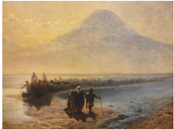
L'Arche s'échoua dans le massif de l'Ararat. Noé descendit du Mont sacré et planta une vigne dans la Vallée de l'Ararat. L'illustration est un détail du tableau peint par Aivazovsky au XIX e siècle Noé descendant du Mont Ararat .

En 301, l'Arménie, royaume indépendant, adopta le christianisme comme religion officielle d'État. Le monarque du pays, Tiridate III avait été converti au christianisme par St. Grégoire l'Illuminateur. Les terribles développements ayant conduit à cette date historique ont été considérables. Néanmoins, toutes les formes de paganisme ont été promptement et radicalement éliminées, une réalisation significative qui a établi une vaste série progressiste de valeurs et de traditions. Malheureusement, son voisin occidental, l'Empire Romain, devait encore souffrir d'importantes persécutions de chrétiens, même après l'adoption du christianisme par l'Arménie. En fait, les persécutions commencées sous l'empereur réformiste Dioclétien ont été les plus cruelles de l'histoire romaine, car des saints ont été martyrisés.