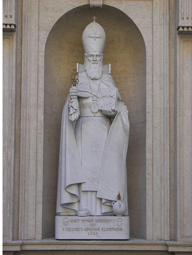
Au Vatican, la statue en marbre de 26 tonnes de Grégoire l'Illuminateur est placée le long de la façade nord de la Basilique Saint Pierre – Basilica a Sancti Petri – à proximité notable de l'entrée principale.